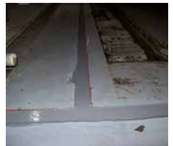
已使用贝尔佐纳(Belzona) 4521 成功修复