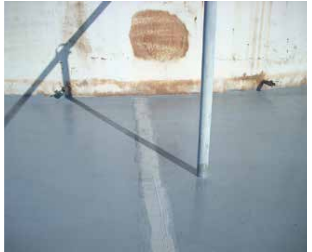
用于在隔离区翻新失效接缝